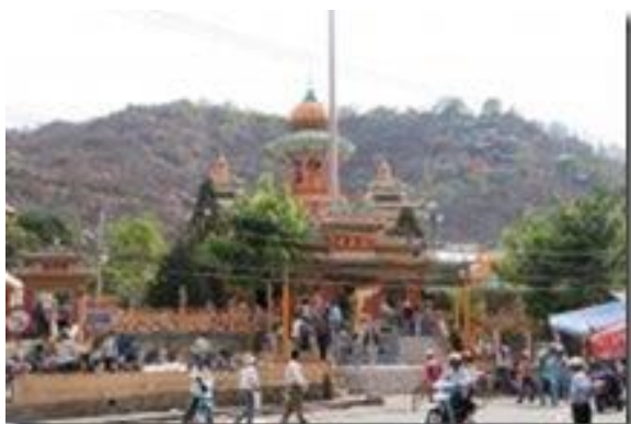
Pagode Tay An