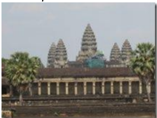
Cambodge : Angkor Wat