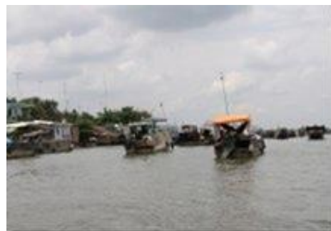
Sur le Mékong