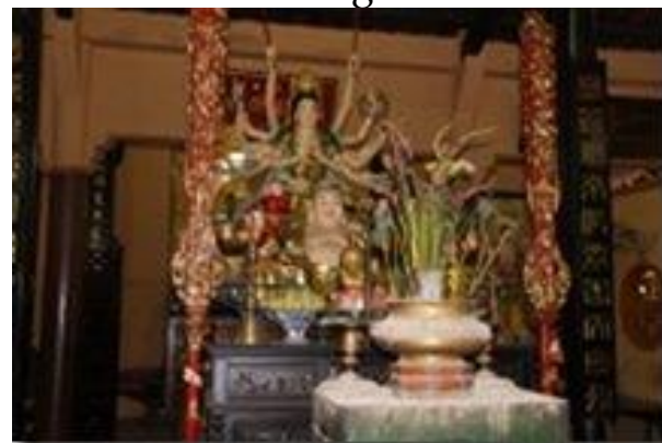
Intérieur de la pagode Tay An