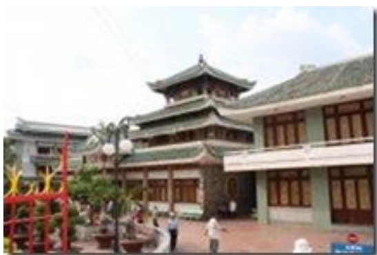
Temple de Ba Chua Xu ou temple de la déesse Xu