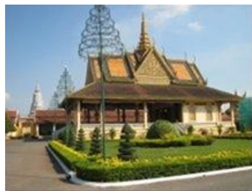
Aperçu du Cambodge - Palais Royal