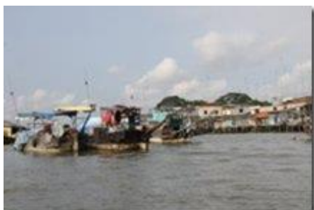
Marché flottant de Cai Bai