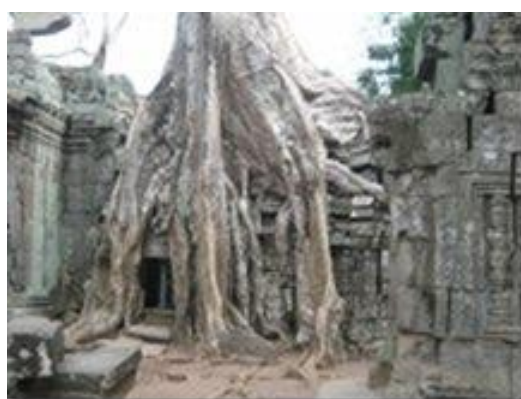
Cambodge : Ta Prom